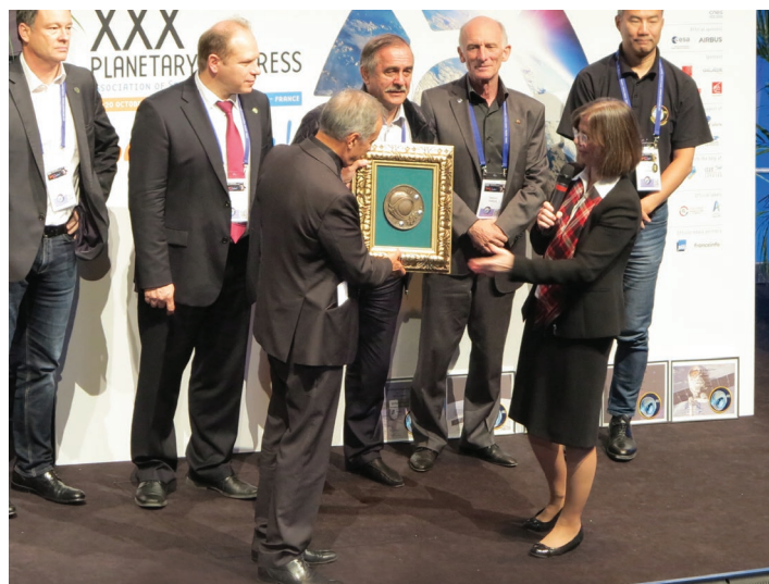
Вручение награды ASE на конгрессе в Тулузе, 2017 г.

С 2009 г. было введено звание «Почетный член ассоциации» и впервые это звание было присвоено А. Леонову и Р. Швайкарту на 22-м конгрессе в Праге, Чехия.