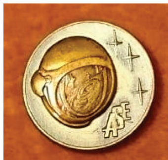
Значок члена ASE