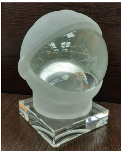
Высшая награда ASE «Хрустальный шлем»

Во время каждого Конгресса проводится церемония представления новых членов с вручением каждому из них значка члена ASE. Присуждается высшая награда ASE «Хрустальный шлем» – человеку, совершившему выдающийся вклад в развитие космической мысли и космической науки. Учреждена в 1985 г. на 1-м Конгрессе ASE во Франции (в первоначальном варианте это была пластина, сделанная по эскизу А.А. Леонова) и там же впервые была вручена Ж.-И. Кусто. В 2011 г. по инициативе и проекту Ю.В. Усачева вид награды был изменен и утвержден Исполнительным комитетом. В настоящее время это объемный хрустальный шлем, прототипом которого стал шлем Ю.А. Гагарина. К ежегодному Конгрессу его изготавливают в Санкт-Петербурге.