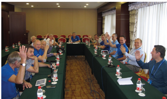
Заседание исполкома Российской ассоциации участников космических полетов, 2014 г.

К участникам космических полетов сейчас не относятся те, кто участвовал в подготовке к космическим полетам и был сертифицирован как космонавт, но так и не совершил реальный космический полет, в том числе вследствие аварий и катастроф после старта, совершив полет в атмосфере Земли, без выхода за ее пределы в космическое пространство. Это не слишком соответствует цели ASE передавать всему человечеству космическое восприятие Земли. Ведь учредители ASE вовсе не думали об элитарном клубе. А космонавты, прошедшие профессиональную подготовку, гораздо более других людей подготовлены к космическому видению.