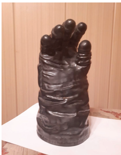
Приз ASE «Космическая перчатка»