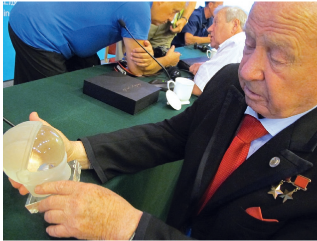
А.А. Леонов перед вручением «Хрустального шлема», 2014 г.

По эскизу А.А. Леонова был разработан медальон. Затем медальоны были изготовлены из бронзы памятной доски, которая осталась после переименования «ЦПК имени Ю.А. Гагарина и Л.И. Брежнева» в «ЦПК имени Ю.А. Гагарина». Впервые медальон А.А. Леонова был вручен в 1990 г. на 6-м Конгрессе в Голландии В. Оккелсу. За все годы медальон получили 56 человек.